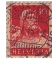
Los 33 Typ I