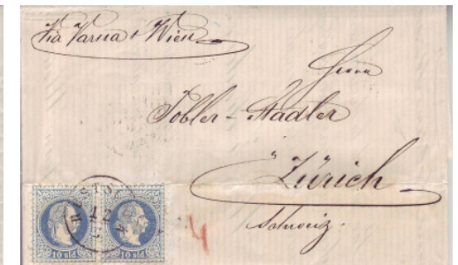
Los 273 Levante

Weitere über 220 hochauflösende Abbildungen im Internet unter www.alnet.ch/Briefmarken.htm