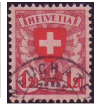
Los 35 PF