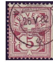
Los 21 (w.P.)