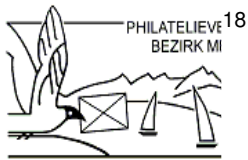
Philatelieverein Bezirk Meilen