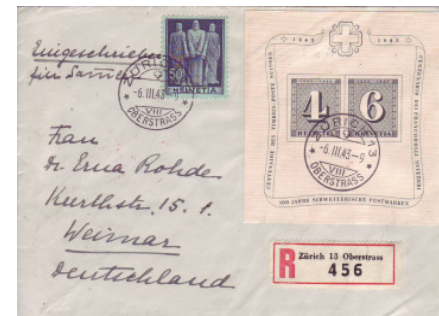
Los 193 Zensur