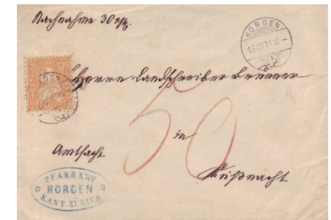
Los 14 Nachnahme