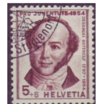
Los 157 (D'prg.)