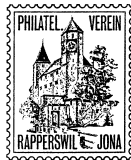
Philatelistenverein Rapperswil Jona