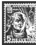
Philatelistenklub Wetzikon u. Umgebung