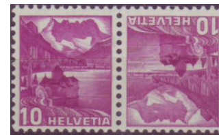
Los 75 Doppelprägung